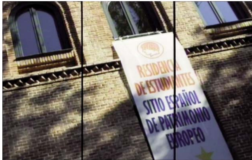
Fotogramas de documental 100% Residencia. Una tradición recuperada integrada en la exposición